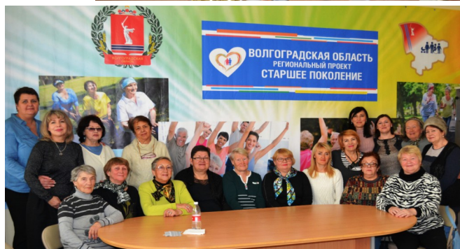
ДО НОВЫХ СОЦИАЛЬНЫХ МАРШРУТОВ, ДРУЗЬЯ!